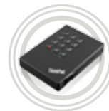
Disque dur sécurisé et portable ThinkPad® USB 3.0