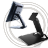
Support universel tout-en-un Lenovo™