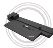
Station d'accueil ThinkPad® Performance