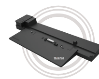
Station d'accueil ThinkPad® Performance