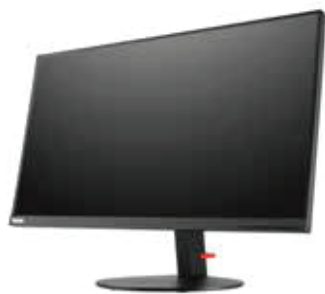
Moniteur ThinkVision® P27u