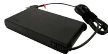
Adaptateur secteur 230 W ThinkPad® Slim