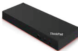
Station d'accueil Thunderbolt™ pour station de travail ThinkPad®